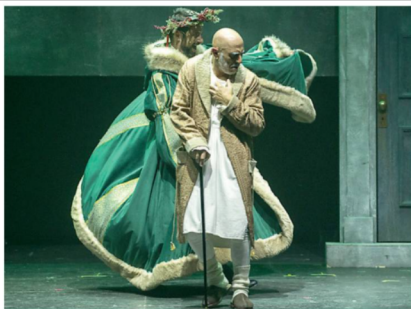
Una scena del musical A Christmas carol

STASERA E DOMANI AL FENAROLI DI LANCIANO